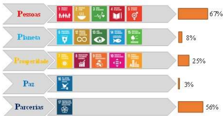
Figura 2 – Percentagem de atividades que contribuem para a concretização dos ODS por pilar.